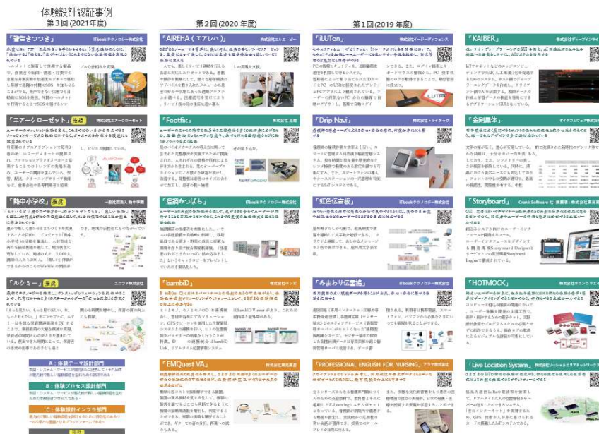
認証/推奨事例の紹介パンフレット

体験設計認証/推奨された事例は、パンフレット、ホームページ掲載されると共にCXDSおよび会員が出展する各種展示会/発表会にて展示/紹介されます。